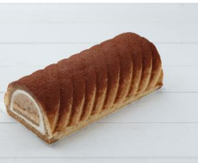
「東京ティラミスロール」