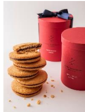
「マルコリーニ ビスキュイ 6枚入り」