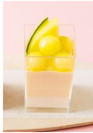
「マスクメロンババロア」