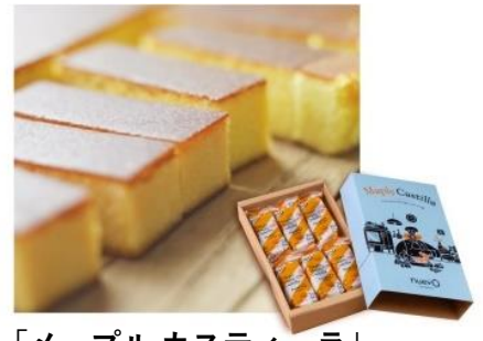
「メープル カスティーラ」

価格：6個入 1,080円 店舗：nuevo by BUNMEIDO(グランスタ東京) 卵・砂糖・小麦・水飴だけのシンプルなカスタードにメープルシロップを加えることで、濃厚なメープルの香りが口いっぱいに広がり、贅沢感が味わえるスティックタイプの焼き菓子です。