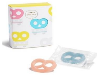
「グミツェルBOX 6個セット (東京グランスタ店限定)」

価格：800円 店舗：ヒトツブカンロ(グランスタ東京) 外側はパリッと、中はしっとりとした次世代食感グミ「グミツェル」の6個セットです。 ※パッケージのみ東京駅限定