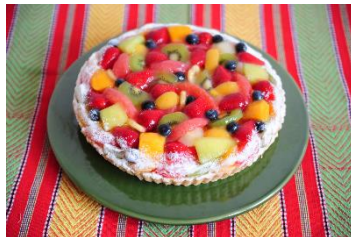
「タルト・メリメロ」