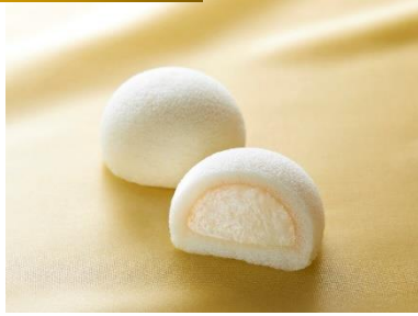
「萩の調 煌 ホワイト」

価格：6個入 1,200円 店舗：菓匠三全(グランスタ東京) 仙台銘菓「萩の月」で有名な菓匠三全の東京駅限定新商品。「ホワイトエッグ」を使用し、独自の製法で「ホワイトカスタードクリーム」を炊き上げました。