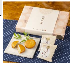
「揚げまんじゅう10個 (ミルクあん入)」