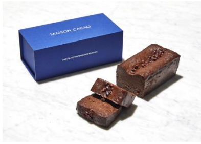
「生ガトーショコラ」