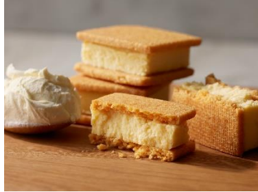
「チーズケーキサンド」