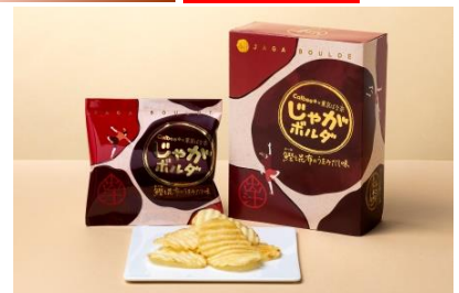
「Calbee+ × 東京ばな奈じゃがポルダ 鯉と昆布のうまみだし味」

価格：4袋入 756円 店舗：じゃがポルダ(グランスタ東京) 厚切りポテトチップスに、凝縮したおいしさのしずくをふきかけました。「広尾 小野木」監修の「鯉節と昆布からとりきった華やかに薫る“だし”の旨味」をまとめて。