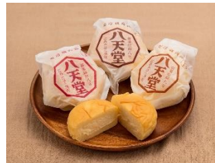
「クリームパン5種詰合せ」