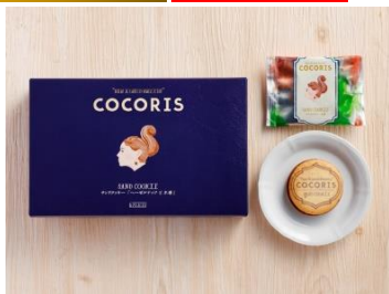
「サンドクッキー ヘーゼルナッツと木苺」