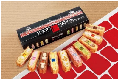
「東京駅限定 ワッフル10個セット」