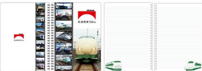
B5リングノート新幹線 935円(税込)

表面にE2系、裏面に200系のイラストをデザインしたマルチスマホケースです。シールで貼り付ける仕様なのでさまざまなサイズのスマートフォンにお使いいただけます。 ※スライド式、ポケット付き ※対応サイズ:縦158mm×横78mm以内のスマートフォン