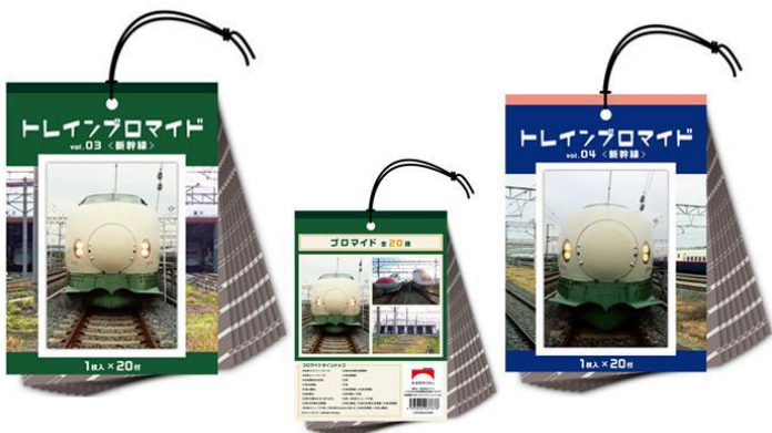
トレインプロマイド(Vol.3, Vol.4) 各990円(税込)

昔懐かしい、駄菓子屋さんにあったプロマイドくじを鉄道プロマイドで再現！プロマイドは全てJR東日本社員が撮影した秘蔵写真です。束ごと大人買いする嬉しさ、何が出るかわからないワクワク感をお楽しみください。 ※各プロマイド全20種セットでの販売となります。 ※サイズ:縦200mm×横145mm