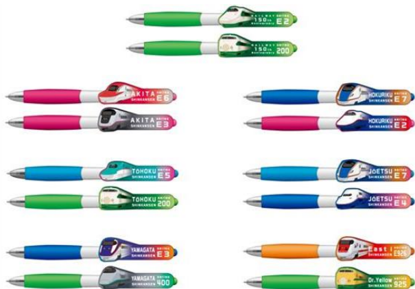
レリーフボールペン 各990円(税込)

200系とE2系のイラストがデザインされた15cm定規です。イラスト部分は凹凸をつけて浮き出た作りになっており、立体感があります。