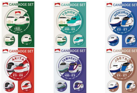
缶バッジ 各880円(税込)

クリップ部分に新幹線車両のイラストがあしらわれたボールペン2本セットです。イラスト部分は凹凸をつけて浮き出た作りになっており、立体感があります。 インク色:黒 ボール径:0.7mm