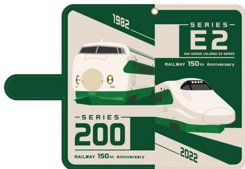
マルチスマホケース 200系E2系 3,850円(税込)

昔懐かしい、駄菓子屋さんにあったプロマイドくじを鉄道プロマイドで再現！プロマイドは全てJR東日本社員が撮影した秘蔵写真です。束ごと大人買いする嬉しさ、何が出るかわからないワクワク感をお楽しみください。 ※各プロマイド全20種セットでの販売となります。 ※サイズ:縦200mm×横145mm