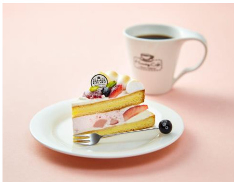
Suicaのペンギンケーキセット(1,340円～) Suicaのペンギンオリジナルお土産フォークと お好きなドリンク付