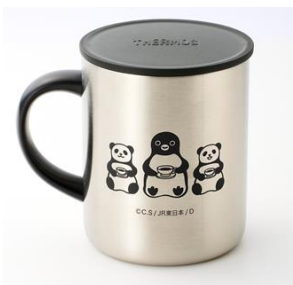
真空断熱マグカップ(各3,200円) ミルクホワイトとステンレスの2色展開