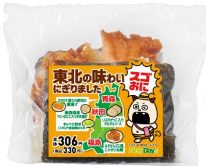
スゴおに 東北の味わいにぎりました 9月5日発売 330円

青森・秋田・福島の特産品や郷土料理をイメージした具材を詰め込みました。食べ応え抜群のおにぎりです。