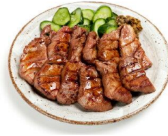
味の牛たん喜助 職人仕込牛たん詰合せ 5,400円