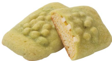
ずんだ&ホワイトチョコづくし 8月29日発売 150円

宮城県内産のホヤと一緒に「ほやお酔い」を加え、しょうゆベースのだしで味付けしました。ホヤの香りと旨みがバランスよく口の中に広がるおにぎりです。