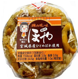
福島・宮城・山形・岩手・秋田・青森 エリア販売商品