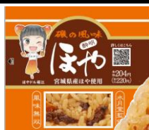
首都圏及び静岡・長野・新潟エリア販売商品