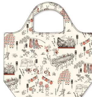
東北6県×鳥獣戯画 8月29日発売

人気の鳥獣戯画が東北6県のお祭りに遊びに来た！NewDaysでしか買えないオリジナル商品です。全4種発売します。