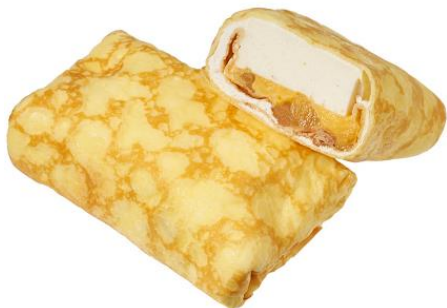
EKI na CAFE りんごのムースクレープ 8月29日発売 198円

青森産ふじりんごのカスタードクリームを使用したりんごのムースと青森県産ふじりんごの角切り、カスタードとホイップクリームをクレープ生地地で包みました。