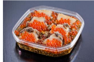
中村家 三陸海宝漬 350g 5,000円