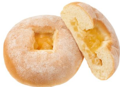
アップルフロマーージュ (青森県産トキりんご) 9月12日発売 155円

青森県産トキりんごブレザープ入りのフロマーージュクリームを包み、トキりんごフィリングをトッピングしました。