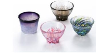
津軽びいどろ あおもりの肴盃セット 5,500円