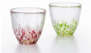
津軽びいどろ りんごカップペア 3,850円

URL： https://www.jreastmall.com/shop/c/c84/ ※8月29日(火)から特集ページも公開予定