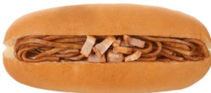
なみえ焼そば風ドッグ 9月12日発売 150円

通常の約3倍もある太い麺が特徴の福島県ご当地グルメ「なみえ焼そば」をイメージしました。