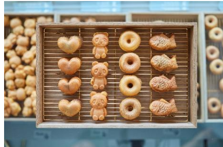
ギンザプティカスタ