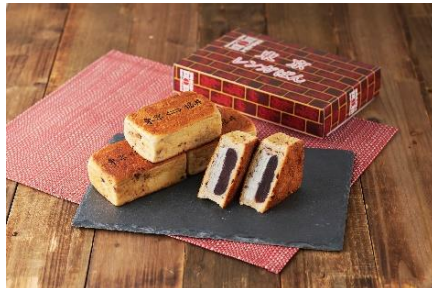
東京あんぱん豆一豆