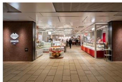
スイーツ・デリが揃う 「京葉ストリートエリア」