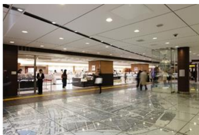
限定商品や限定ショップが並ぶ 「銀の鈴エリア」