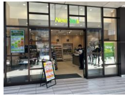
大井町トラックス店