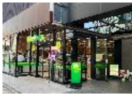
サウスゲート新宿店