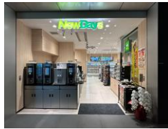
高輪ゲートウェイシティ店