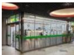
コクーンタワー新宿店