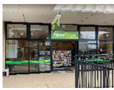
ジアウトレット湘南平塚店