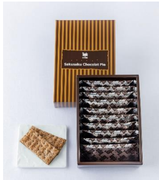
トップス サクサクショコラパイ 10枚入イメージ