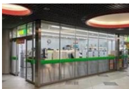
コクーンタワー新宿店