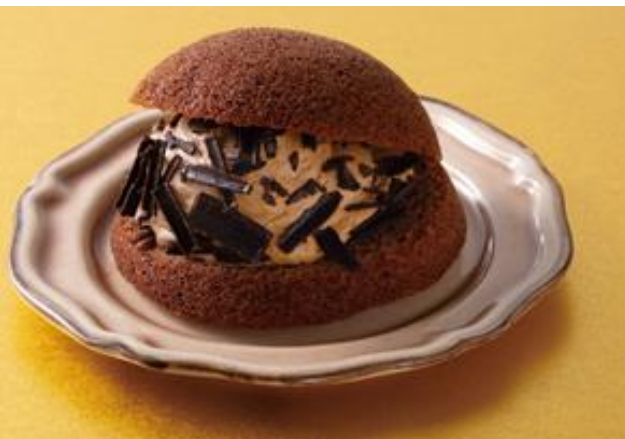
EKI na CAFE シフォンサンド キャラメルチョコクリーム 1月21日(火) 発売 238円