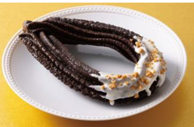
Panest チョコチュロッキー 1月21日(火) 発売 160円

チョコクリームとキャラメルチョコクリーム、削りチョコをサンドしたココア味のシフォンサンドです。Top'sの「チョコレートケーキ」をイメージしたチョコレートクリームに、キャラメルチョコクリームもサンドし、飽きずに食べられる仕様にしました。 ※首都圏及び静岡・長野・新潟・宮城・福島・山形・岩手エリアで販売