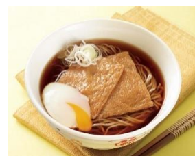
&lt;王子そば通常価格 570円&gt;

当社ホームページ・SNS（Twitter/Instagram/Facebook）・開業チラシに掲載するQRコードを、王子店の券売機で利用すると単品かき揚げが無料になります（単品かき揚げのみの注文は不可）。