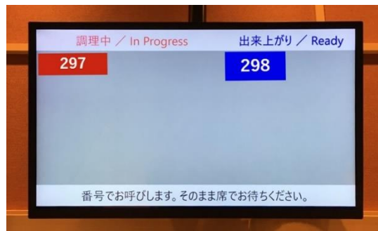
券売機連動呼び出しシステムの画面：各食券番号が画面に表示される