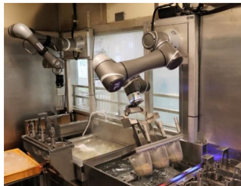
そばいちペリ工海浜幕張店での稼働の様子②： 洗う、締める