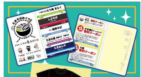
(上) 配布予定の付箋 (下) 特製Tシャツ

株式会社小田急レストランシステム（本社：東京都渋谷区）、京急ロイヤルフーズ株式会社（本社：東京都大田区）、株式会社JR東日本クロスステーション（本社：東京都渋谷区）、株式会社東急グルメフロント（本社：東京都目黒区）、株式会社レストラン京王（本社：東京都府中市）の5社は、2023年2月22日（水）から同年3月31日（金）まで各社が運営する駅そば業態において「えきそばめぐり～駅そばシールラリー～」を初めて共同開催します。