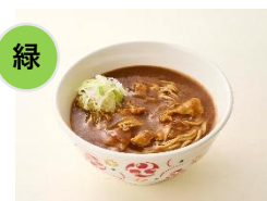
①至福のカレーそば（単品600円）