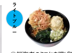
⑤桜海老のミニかき揚げ天とドデカ肉団子天そば（単品620円）