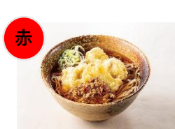
②まぐろ担々天ぷらそば（単品650円）