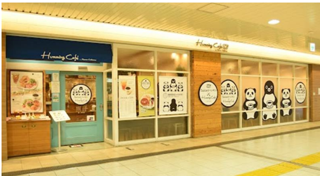
エキュート上野内 ハミングカフェ ショップ外観

なお、今後も引き続き、新メニューやオリジナル商品など魅力ある商品を続々発売予定です。