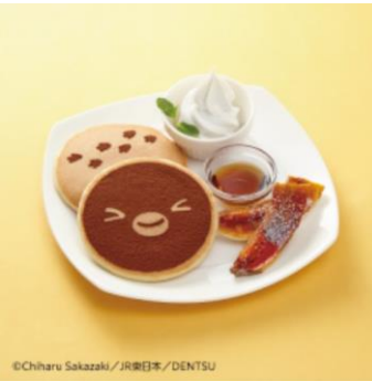
Suicaのペンギン パンケーキ ~焼バナナ&ソフトクリーム付~ (790円/毎日14:00から30食限定で販売)