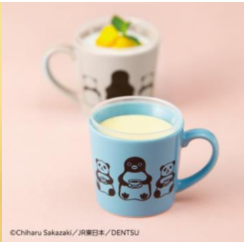
Suicaのペンギン なかよしプリン ~マグカップ付~(790円) ※第1弾としてブルーを販売 ※順次カラー展開予定 ※テイクアウト可能