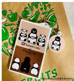
下段左： Suicaのペンギン カフェアクリルスタンド (1個 990円)