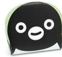
「Suica のペンギン 二折財布」<キタムラ> 25,000 円（税込）