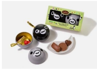
「Suica のペンギン まんまる缶（グリーン）」<Caffarel> 3,000 円（税込）