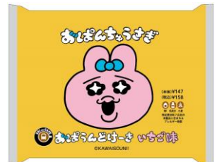
<パッケージは3パターンあります>

コラボスイーツ おぱうんどけーき いちご味 12月20日（火）発売 158円（税込）