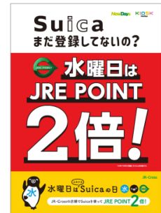
水曜日はエキナカSuicaの日