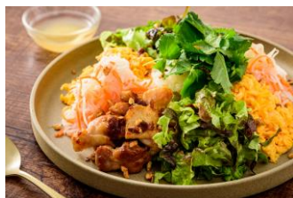
コムアンフー ～ベトナム風まぜご飯～ (2人前) 1,350円 (税込)

NewDaysで受け取れる「楽彩」のミールキットで、新鮮なお野菜を使用したアジアンメニューが気軽に楽しめます。ぜひこの機会にお試しください。