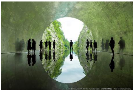
(マ・ヤンソン / MAD アーキテクト「Tunnel of Light」 (大地の芸術祭作品))

新潟県の南部に位置する十日町市は、世界有数の豪雪地帯として知られる街です。信濃川がもたらした肥沃な大地と、山々から注ぐ清らかな雪解け水により、最高級ブランド「魚沼産コシヒカリ」の産地として名高いほか、伝統技術が息づく「きもの（織物）の街」としても知られています。さらに、大自然を舞台にした世界最大級の国際現代芸術祭「大地の芸術祭」の開催地としても、国内外から広く注目を集めており、豊かな自然、伝統文化、そして、現代アートが融合する唯一無二の魅力にあふれています。