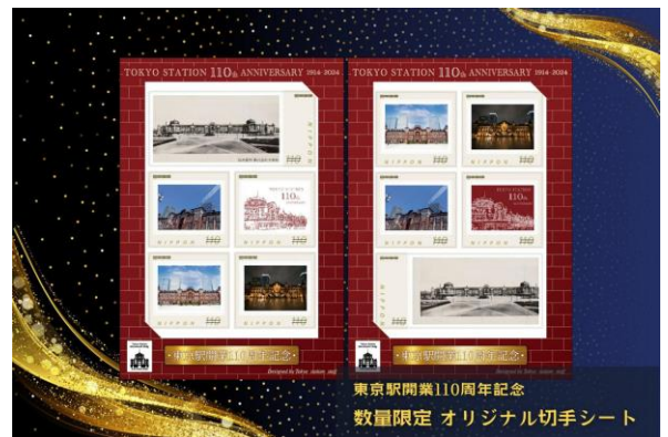
左：デザイン① / 右：デザイン②