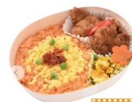
冷凍チキン弁当 750円(税込)

※販売商品は全て冷凍されており、ご自宅などで解凍する必要があります。なお、保冷剤は同梱されておりません。