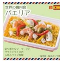
世界の機内食 バエリア 1,100円(税込)