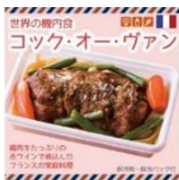
世界の機内食 コック・オー・ヴァン 1,100円(税込)