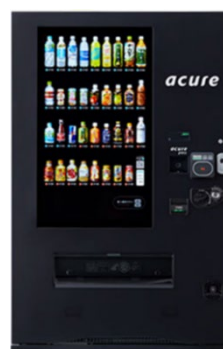
＜イノベーション自販機＞