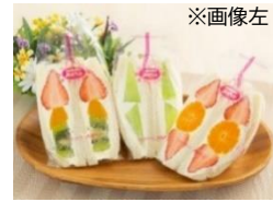
※画像左 「フルーツスペシャル(いちご)」 サンドイッチハウス メルヘン