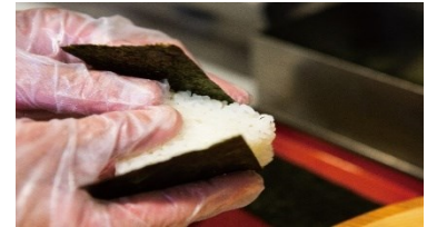
おむすびをむすぶ様子