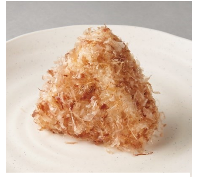
猫じゃらしむすび