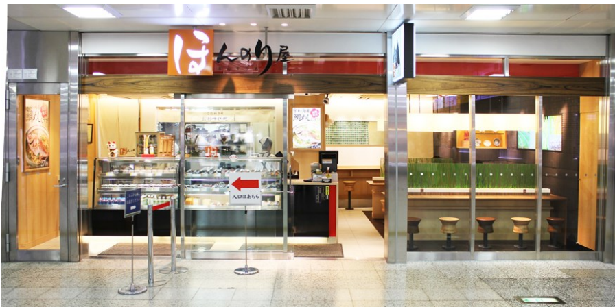
ほんのり屋東京本店（1号店）

首都圏のエキナカに展開するおむすび専門店。2002年3月、東京駅八重洲中央口改札内に、第1号店となる「ほんのり屋東京本店」を開業。以来、多くのお客さまのご支持をいただき、東京・神奈川・埼玉の駅構内に店舗を増やし、現在は20店舗を展開しています。創業時から「あの頃、お母さんがつくってくれた愛情いっぱいのおむすびを再現したい」という変わらぬ思いのもと、20年間、会津コシヒカリを店内で炊飯し、手作りにこだわったおむすびをむすんでいます。