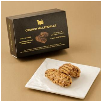
クランチミルフィーユ イメージ